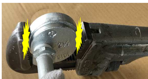
※シール面が傷付く