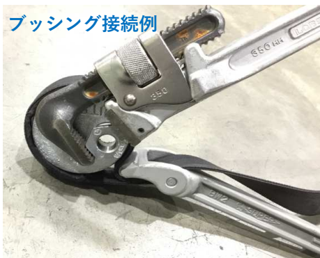
ブッシング接続例