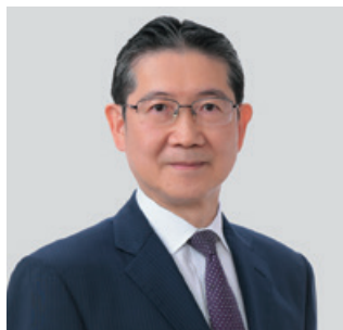
代表取締役社長 (CEO兼COO)