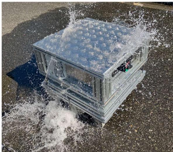
防水性能確認試験の様子