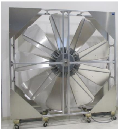
COLS社で開発中の風力発電システム（部分）

COLS社では同社独自の「E・A・T」技術(※)を活用した風力発電システムを開発中です。理研機械がピストンリング製造設備の設計開発で培った機械設備ノウハウを組み合わせ、風力発電システムの性能向上を目指します。また、理研機械が立地する新潟県柏崎市は「風の街・海の柏崎」という通称もあるほど風を感じられる地域であり、その特性を生かした実機評価をして参ります。更に、本件は新潟工科大学「風・流体工学研究センター」（柏崎市）の御協力も得ながら開発を推進していく予定です。